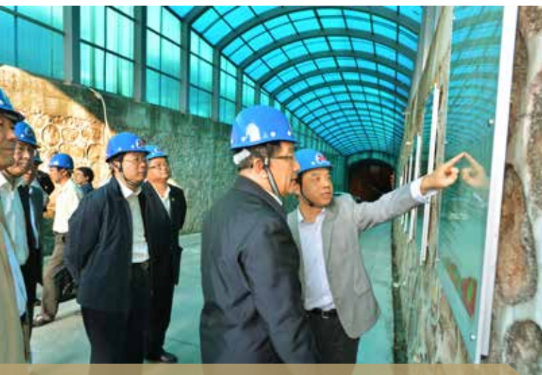
2014年11月15日，科技部部长万钢访问大亚湾反应堆中微子实验

工程和一半的探测器研制。美国投入3400万美元，研究人员约100人，承担约一半的探测器研制。其他国家和地区各有几十万至100万美元的实物或经费贡献。这是中美在基础研究领域规模最大的合作之一。在国内也开创了国家、地方与企业共同支持基础科学研究的先河。