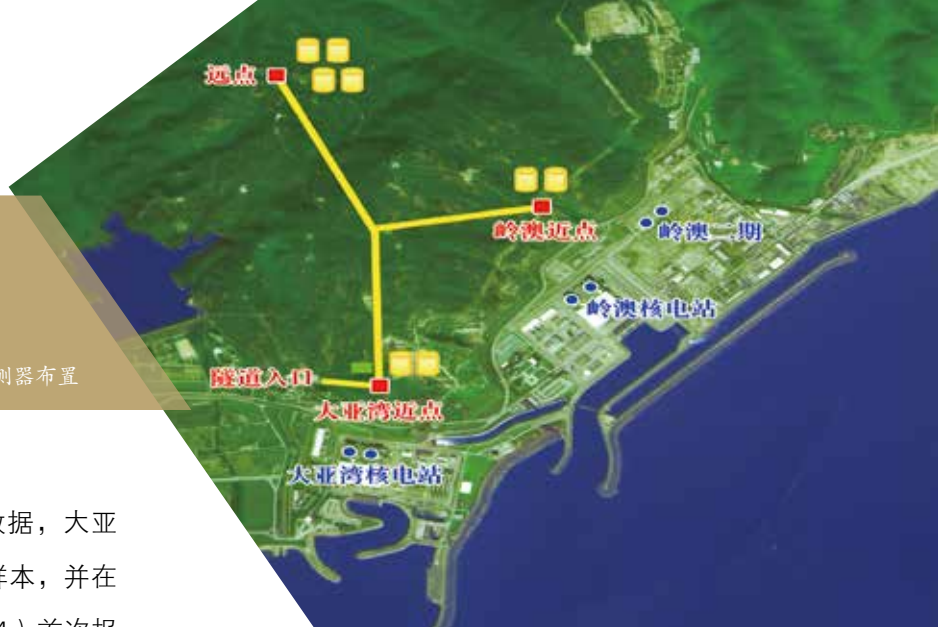
大亚湾实验探测器布置