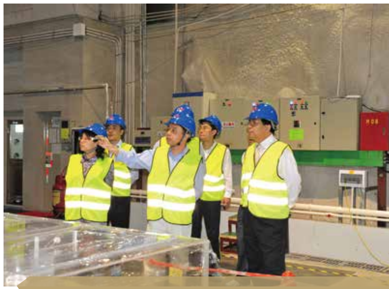
2010年11月15日，中科院副院长白春礼视察大亚湾反应堆中微子实验

大亚湾实验的近点探测器将测量反应堆中微子流强到非常高的精度，能够提高反应堆中微子流强