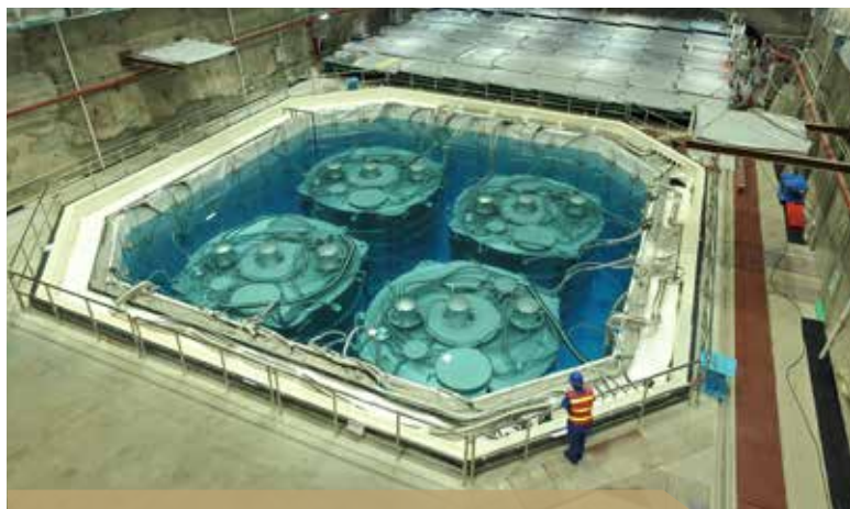
大亚湾反应堆中微子实验3号厅——4个中心探测器

大亚湾实验是一个以中国为主、多国和地区参与的重大国际合作项目。大亚湾国际合作组不断发展壮大，目前由来自7个国家和地区的42个研究机构和大学，200多名研究人员组成。由中国承担全部的土建