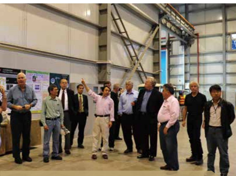
2012年11月4日，美国能源部官员访问大亚湾反应堆中微子实验

大亚湾实验装置和所获取的数据对所有合作组成员免费开放。新合作组成员的接纳由现有合作组的研究代表委员会负责审理。