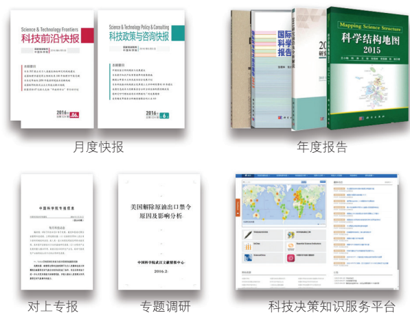
图1 中科院科技战略情报系统主要产品与平台

工又有协同的战略情报研究服务体系，体现出较强的系统性和专业性，已经产出基于科技情报综合、分析的特色产品（图1），在业界获得很好反响，成为中科院乃至我国科技决策人员和科技人员可以依赖的重要力量，为体现中科院国家科技智库职能发挥了基础性作用 [8] 。