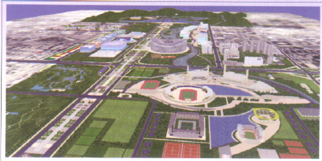
▲奥运主场馆区三维仿真系统