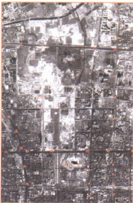
▲2004年4月19日获取的卫星影像图